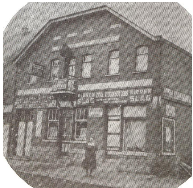
'Het Vlaams Huis', (nu 'Bloemen Flora') in de helft van vorige eeuw dé plek waar je moest zijn om te dansen, maar dus ook om van toneel te genieten.