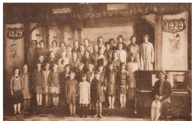
In het meisjespensionaat van Ledeborg was een degelijke theateraccommodatie voorzien