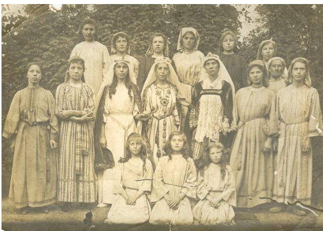
Vrome Bijbelstukken waren zeer populair begin vorige eeuw

Toneelspelen werd voor Yvonne een uitlaatklep. Haar schranderheid en creativiteit kon ze uitleven op de planken van de parochiezalen.