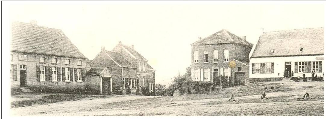
Achter de herberg 'te Stappes' (links) op de Dries stond de toneelzaal waarin tijdens WOI toneel werd gespeeld