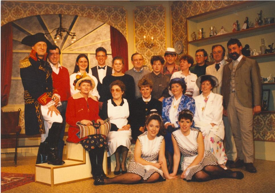
Kunst en Muziek in februari 1989, 'Een beeld van een man' op het podium van Sint- Franciscus.

Zij lieten ieder jaar twee keer de grote zaal van het Sint-Franciscus-Instituut vollopen. Het was ook dit gezelschap dat tijdens de herdenking van De Dikke van Pamel (1985) en de daaropvolgende Roosdaalse Feesten telkens voor een gesmaakt wagenspel zorgde. Voor hun tienjarig bestaan creëerden ze zelfs een stuk dat de acteurs letterlijk op het lijf was geschreven 'Het onweer en de zilveren Moor' .