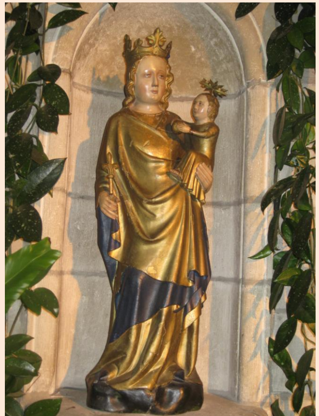
Prachtig 14 de -eeuws beeld van O-L-V van Lombeek