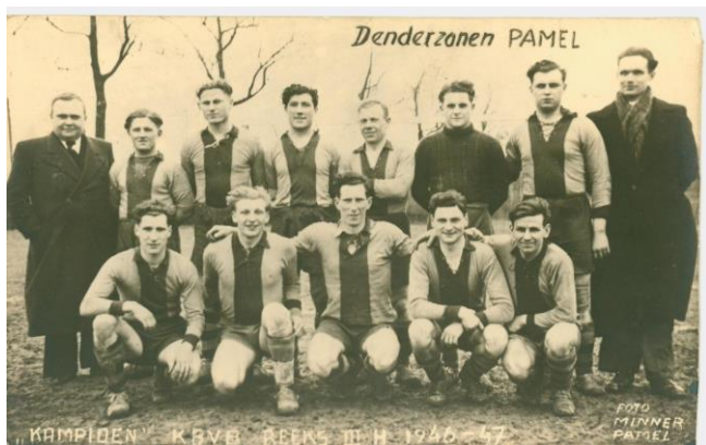
De kampioenenploeg van 1946

Er kwamen nieuwe spelers bij en we speelden voortaan op een terrein van de familie Meert aan de Ninoofsesteenweg. Ik ben blijven voetballen tot mijn vierendertigste, toen was ik voor de voetbalsport versleten. Hoe het verder allemaal is verlopen zullen anderen je wel vertellen. Ik heb met het voetbal veel schone momenten beleefd en heel veel vriendschap mogen ervaren. Denderzonen Pamel, dat blijft een belangrijk stuk van mijn jong leven!"