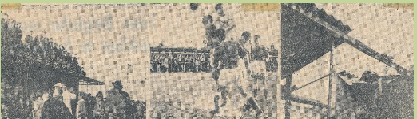
Ook de kranten brachten uitvoerig verslag uit van de sensationele match die uiteindelijk op een 1-1 gelijkspel zou eindigen.