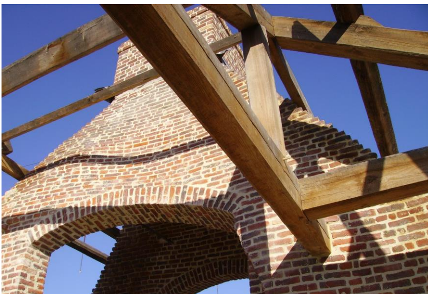
De monumentale schouw met het prachtige metselwerk, nu te bewonderen op de zolder van GC Het Koetshuis.