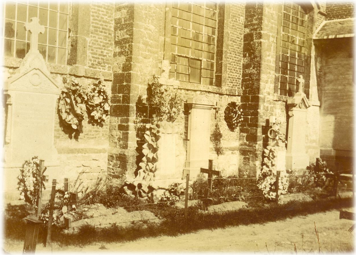
Nooit eerder gepubliceerde foto uit het archief van mevrouw C. Lindemans: grafmonumenten tegen de (in 1904 afgebroken) oude kerk van Pamel. Waarschijnlijk is deze foto 120 jaar oud!!!