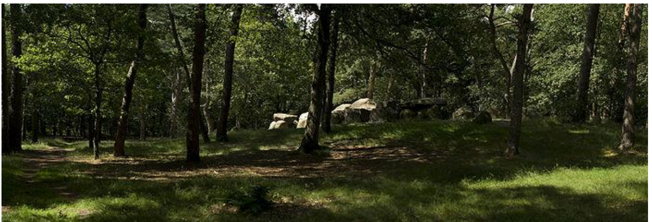
Hunebed in Emmerdennen (NL)

Onze voorzaten in het steentijdperk begroeven hun doden in hunebedden. Het 'Trechterbekervolk' (Noord-Europa) begroef zijn doden collectief in begraafplaatsen, gericht naar het oosten (het heil komt uit het oosten). Zij begroeven hun doden zowel staand, liggend als gehurkt. Deze collectieve grafkelders werden afgedekt met enorm zware stenen.