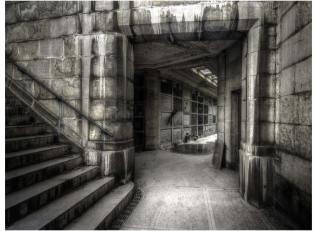
De crypte van Laken, foto Geert de Brabander

Keizer Karel de Grote die het wereldlijke gezag al te graag liet samenvallen met de zegeningen van het kerkelijke gezag, verordende in het voorjaar van 785 het verbod op lijkverbranding. De alom nieuw gestichte kerken kregen aldus een winstgevend geschenk. Werden de mensen eerst nog begraven op de aarden beschermwallen rond de stad, dan ging men snel over, samen met de eerste kerkgebouwen, tot het inrichten van dodenakkers rondom de kerk. Notabelen en priesters werden vaak in de kerk begraven of in crypten onder het hoogkoor. Voorbeelden hiervan zijn de Koninklijke begraafplaats in de Onze-Lieve-Vrouwekerk van Laken en de Sint-Pieters-Basiliek in Rome waar de pausen een ondergronds pantheon bevolken.