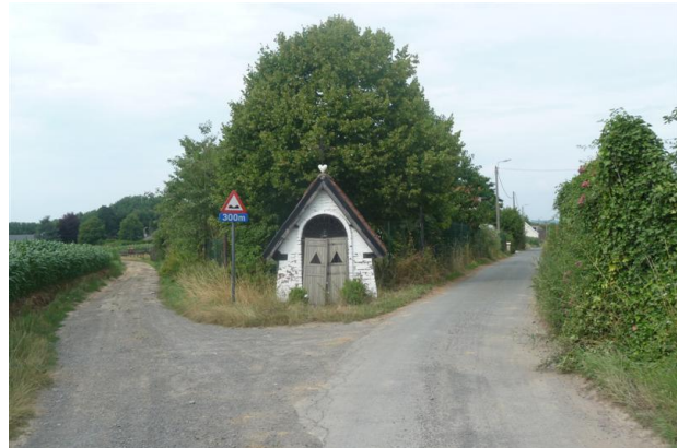
Hierboven: de kapel met links de 'Ios' van 't Roozendael, rechts de Molenkauter. Onderaan: de penibele toestand van de kapel.

Veruit de meeste waren gewijd aan Onze Lieve Vrouw, die duidelijk de populairste heilige was als troosteres der verdrukten en als gids naar haar geliefde zoon. In Roosdaal alleen zijn er minstens zeven kapellen ter verering van Onze Lieve Vrouw van Zeven Weeën.