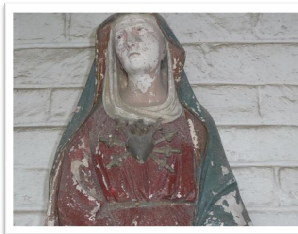
Beeld van het met zwaarden doorboorde hart van Onze lieve Vrouw van zeven Weeën in de kapel aan de Molenkauter

De oudste confrérie van zusters toegewijd aan Maria van Smarten in Ruiselede vierde in 2005 zijn zeventhonderdjarig bestaan. Het symbool van Maria van zeven Weeën is tweëerlei. Op de top van de imposante kapel zien wij het hart doorboord door het kruis, wat het lijden van Maria om haar zoon symboliseert. Op het beeld in de kapel zien wij Maria met haar hart doorboord door zeven zwaarden, de zeven Weeën. Zij draagt het lijden van de mensheid van geboorte tot dood.