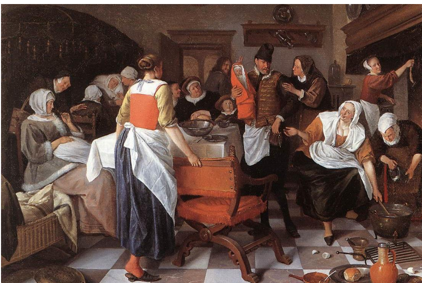
Jan Steen, 1663, het geboortefeest

Bij Gebier (herberg en kolenhandel in de Brusselstraat) werd het orgel aangezet en de kersverse meter gaf het kleintje door aan de achterwares. Het volgende ogenblik draaide zij met de al even frisse peter rond. Goed 'gelanceerd' werd de reeks horeca-instellingen bezocht en telkens werd gul het glas geheven op het nieuwe leven. Tegen valavond kwam het gezelschap in opperbeste stemming binnenvallen. Toen grootmoeder (die thuis gebleven was om op de kinderen te passen en te zorgen voor balleges met trot) hen vroeg waar de dopeling was, drong het langzaam tot hen door dat het voorwerp van hun feestvreugde ergens onderweg moest vergeten zijn. De vader, die van het schrikken het snelst bij zijn positieven was, vatte meteen de terugtocht aan en vond bij Skeiper (herberg tegenover hof te Zijpe) de vroedvrouw aan in een hoekje naast de toog. Net als het kleintje in haar armen, sliep ze de slaap der gelukzaligen. Toch is het achteraf allemaal goed gekomen met het jonge wicht.