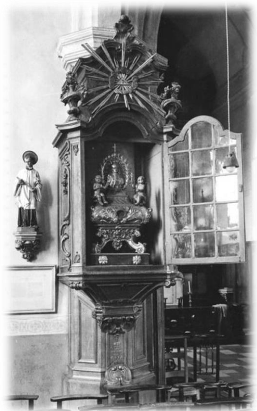
Het reliekschrijn van Sint Leonardus

Was Hubertus de beschermheer voor boer en jager, dan was Leonardus meer de patroonheilige voor huisvrouwen: bescherming tegen vrouwelijke kwalen en vrijwaren van have en goed.