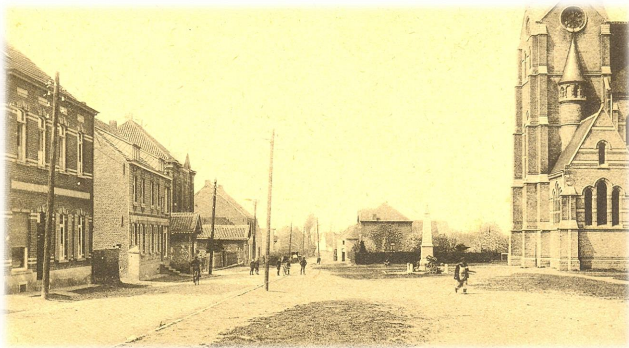
Het dorpsplein van Pamel, een goede tachtig jaar geleden. Het monument werdd toen nog geflankeerd door twee kleine 'kanonnen'.

Terwijl de dag bijna altijd toch nog mooi eindigde met een grandioze zonsondergang boven de Denderboord, schreden bombardon en schepen, door patriottische gevoelens verbonden in een innige omarming, langs het grijze monument, waar vergulde bladeren zich door de wind ophoopten naast de paarsrode chrysanten.