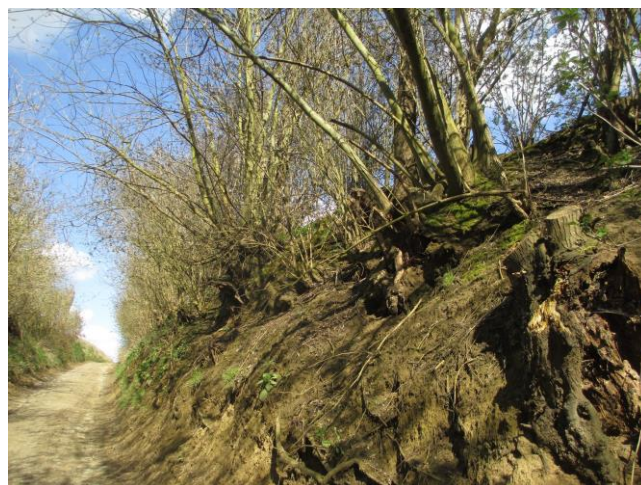
Holle weg op het einde van de Begaardenstraat

Het invullen van die taak verschilt duidelijk van gemeente tot gemeente. Het hangt ook sterk af van de persoon in kwestie. Welke klemtoon gaat men leggen, vertrekt men vanuit een zeer fundamentele positie, neemt men het wat pragmatischer op of laat men al gauw iets 'passeren'... .