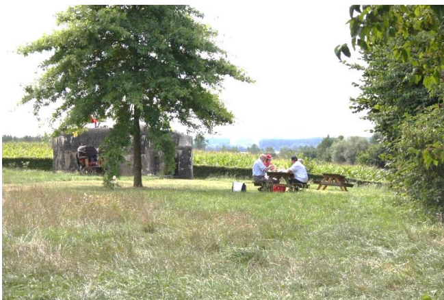
De Bunkerweide is een idyllische plek geworden, een plek voor bezinning en tegelijk een toeristische troef