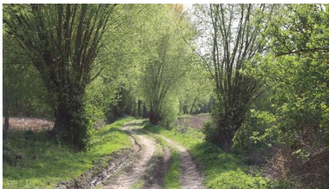
Diepestraat, een prachtig en vergeten stukje natuur in de buurt van de (verdwenen) Wolfputmolen

"Wij hadden ons toen de ambitie gesteld om ieder seizoen één verwaarloosde trage weg opnieuw te openen. Het enthousiasme was groot in den beginne. Één weg per jaar zou ons te minnetjes geweest zijn. De Diepestraat aan de bunkers was de eerste die we hebben open gekregen. De gemeente heeft toen ernstige inspanningen geleverd om hier een succes van te maken. Later volgde in Lombeek de Langebroekstraat".