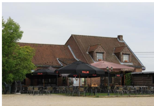
Het open terras van Den Haas, met rechts de overdekte bollebaan.