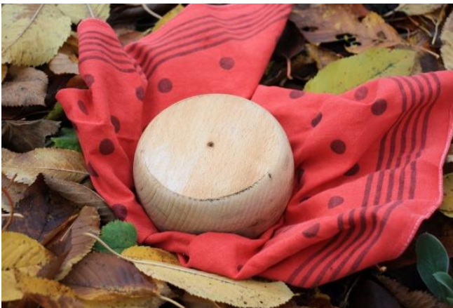
Een bol uit beukenhout, gedraaid door een Waarbeekse houtdraaier.

Aan de Wijngaardbosstraat wordt met relatief kleine bollen gespeeld. Wij lieten ons door een handige Waarbeekse houtdraaier een exemplaar draaien van 125mm \varnothing en 70mm dik, zoals het hoort met een afronding, lichtjes uit het midden (zie foto hierbij). Er wordt heel vaak beuk gebruikt, al zijn essenhout, eik, kastanjelaar en acacia ook zeer geschikt. Op een bollebaan is ook altijd een 'skitter' (schutter) voorhanden. Dit is een bol die meestal uit kunststof wordt vervaardigd en in het midden met lood werd verzwaard.