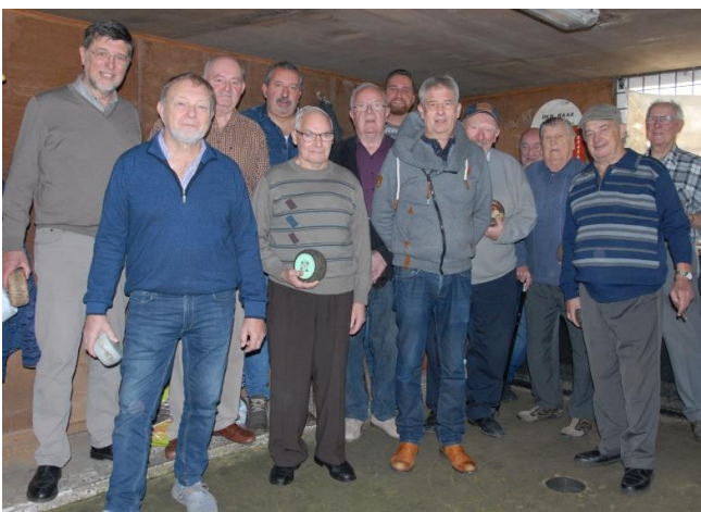
Bolders van Den Haas, november 2019

Bij de Hazenbolders kunnen ze spelen bij alle weer en wind op een baan van ongeveer twintig bij drie meter, aangelegd volgens de traditie. De kleigrond werd vermengd met varkensbloed en hard aangestampt in een lichte komvorm zodat de bollen meestal op de baan blijven. Op de uiteinden is een touw gespannen, langs de zijkant wordt de baan begrensd door een verhard zijpad, in Den Haas een betonnen band van ongeveer een meter breed.