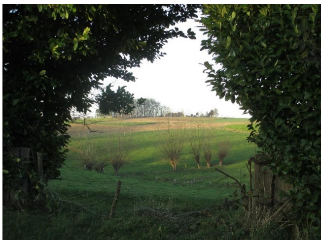
Zicht vanop Stuivenberg, waar tussen het gebladerde aan de horizon het silhouet van 'Den Haas' zichtbaar is.

Neen! We gaan het niet hebben over een ronde wortelvorm waaruit diverse bloemsoorten ontluiken, evenmin gaan wij de wiskundige toer op; dus geen meetkundig driedimensionaal lichaam! Nog minder komt die Utrechtse webwinkel aan bod en zelfs niet het koosnaampje waarmee sommige echtelingen hun wederhelft benoemen. Om te weten waar de 'bol' uit de titel van dit uitgebreid artikel op slaat, moeten wij ons begeven naar de plek waar in lang vervlogen tijden de tektonische platen van Meerbeke, Gooik, Lombeek en Pamel tegen mekaar opdrukten en zo de hoogte van de 'Woestijn' hebben gevormd.