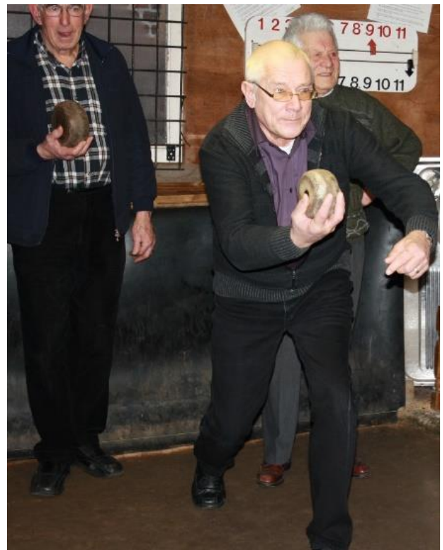
Concentratie bij het aanleggen.

Wanneer er twijfel is over wie 'zjou' (dicht bij 't stek) ligt, komt er soms een passer aan te pas. Als iedereen gebold heeft, worden de bollen geteld van de ploeg waarvan een bol het dichtst bij 't stek ligt. Dan wordt opnieuw gebold, maar nu in de andere richting. De ploeg die 'zjou' lag gaat op. De punten worden opgeteld op de telplaat die tegen de muur hangt. Het spel is uit wanneer een ploeg 11 punten heeft."