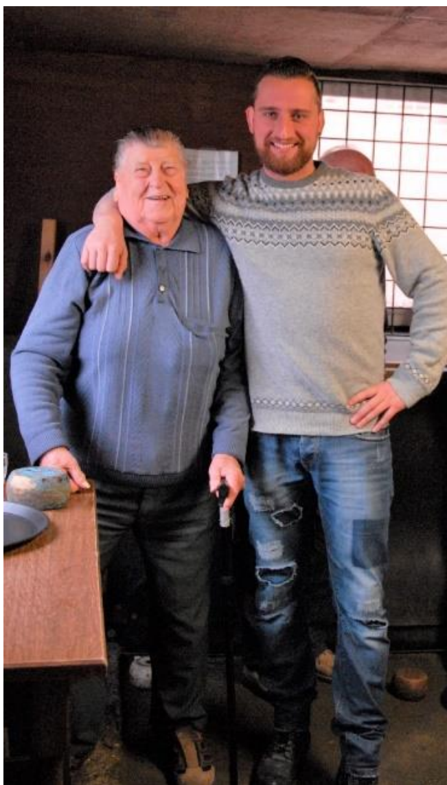
Jong of minder jong, dynamisch of met hier en daar een hapering aan het vege lijf, het bolplezier blijft!

Komt er een heropleving of is het bolspel gedoemd om te worden verdrongen door iets anders dat uit wie weet welke richting, door wie weet wie wordt gepromoot... wie zal het zeggen? Wat we wel weten is dat er vandaag onder het golfplaten dak van de bollenbaan op de Woestijn nog heel veel