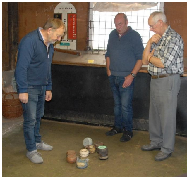
Een spannende situatie...

pret wordt beleefd en warme vriendschap wordt onderhouden.