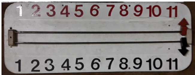
De telplaat aan de muur van de overdekte bollenbaan van café 'In den Haas'