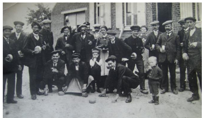
Bollers bij café van Backer, in Strijtem.

Het ligt niet in onze bedoeling onze lezers een lijvige verhandeling aan te bieden over alle varianten wereldwijd (want in vele hoeken van deze aardkloot wordt er een bolletje gerold), wij proberen de 'Gooiklezer' en de 'Rausalezer' klaar te stomen voor een bolervaring in Den Haas. Hier hebben we de luxe van op een overdekte baan te kunnen spelen. Vroeger werd er vaak gebold op een open baan, naast een café zoals op de foto hierboven aan het café van Backer in Strijtem (rond 1920).